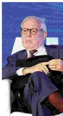
Giovanni Maria Flick

Parla il presidente emerito della Consulta L'appello al dialogo tra i partiti: il principio di auto- determinazione, se mal tradotto, ha effetti sulla convivenza civile